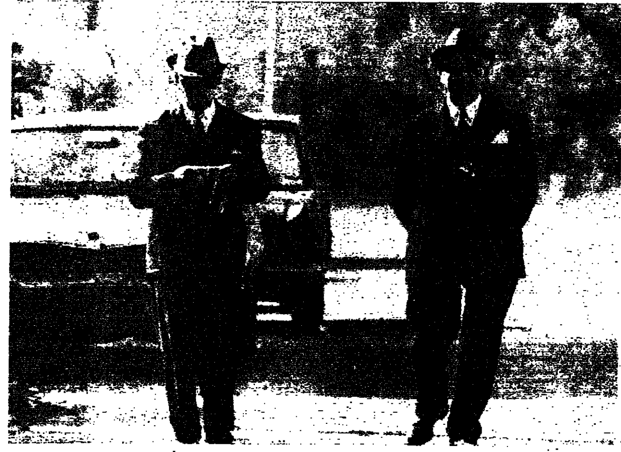
في الصباح ونسلك اسهل الطرق . نلتقيها في دربك ، تحدي بها جيداً .. نحاول القاطنة ، لا نستطيع ، لا مخلوقة .. منظورة ... صورة طبق الاصل ، لا اختلاف فيها الا الاحجام والقاسات ( الصورة لرؤسي الزوقى على طريق مديدا )